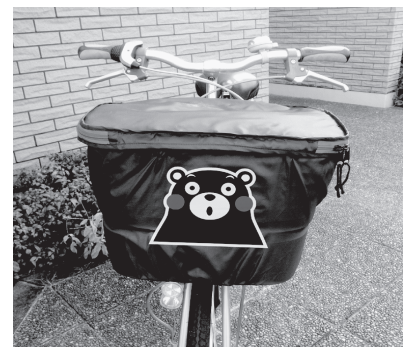
若い女性に大人気のくまモンのひったくり防止カバー