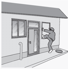
平成26年中の住宅侵入窃盗発生場所